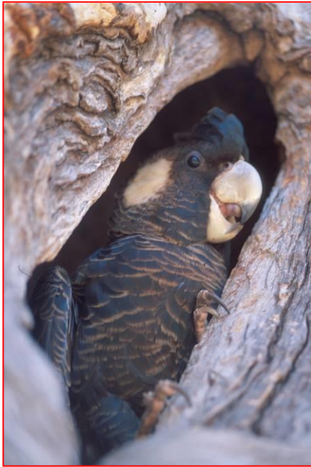
Samica papugi Carnaby w gnieździe