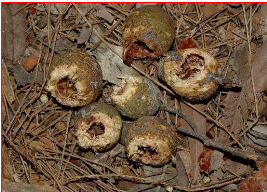
Nasiona drzew Marri pogryzione przez papugi Carnaby